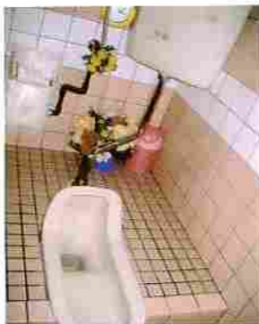
～ビフォー～ 改修前・和式トイレ