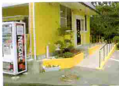
～アフター～ 改修後・ゆるやかなスロープに ・開けやすい引き戸に