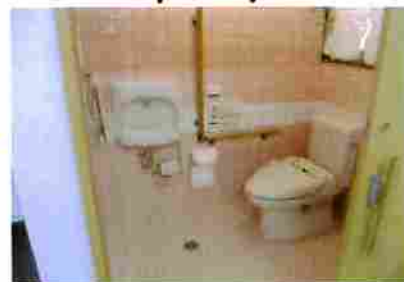
～アフター～ 改修後・だれもが使いやすい車いすトイレに