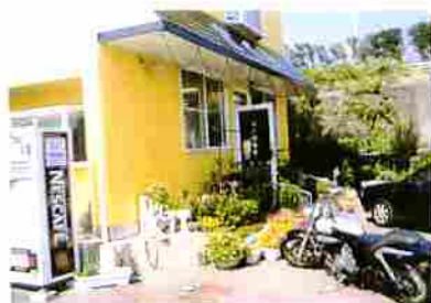
～ビフォー～ 改修前・階段・開き戸